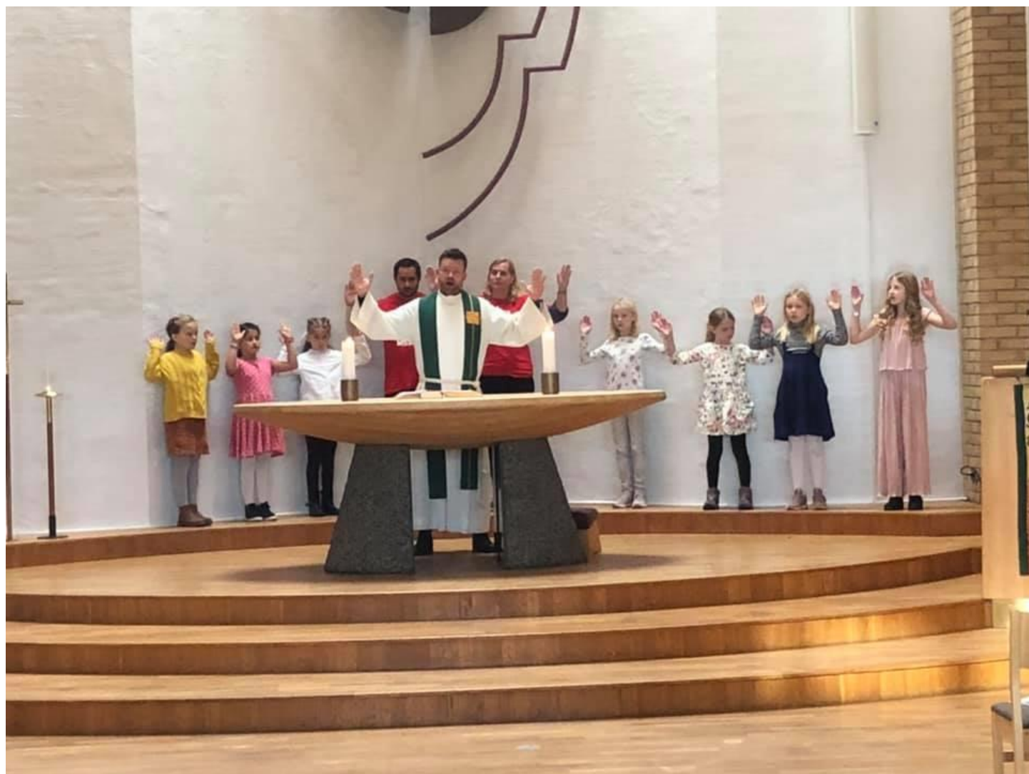
Både prest og barna lyser velsignelsen over menigheten i Udland kirke

Nærmere regler om formene for menighetsmøtets virksomhet gis av Kirkemøtet.