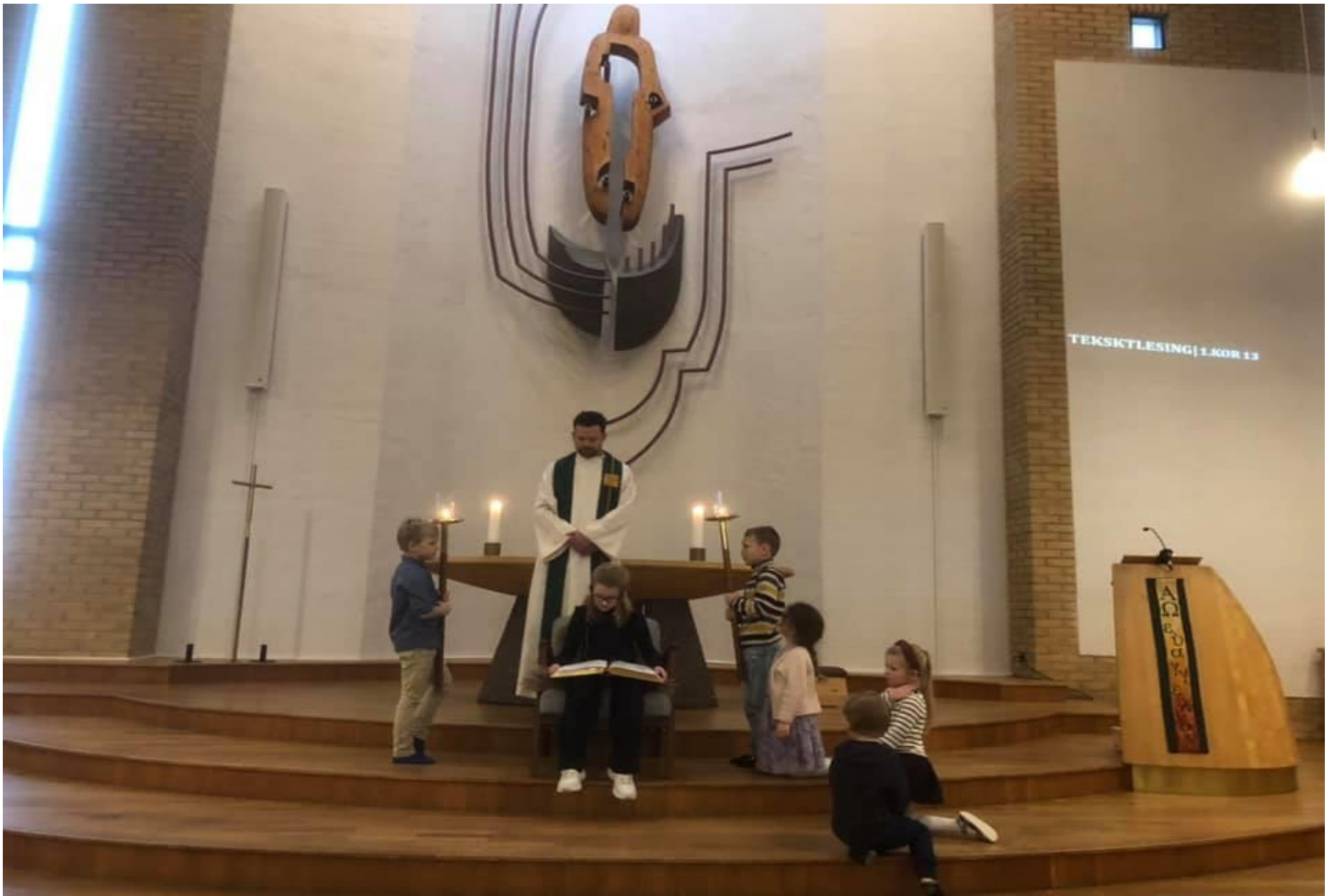
Etter Skoletid-barn som medarbeidere i gudstjenesten