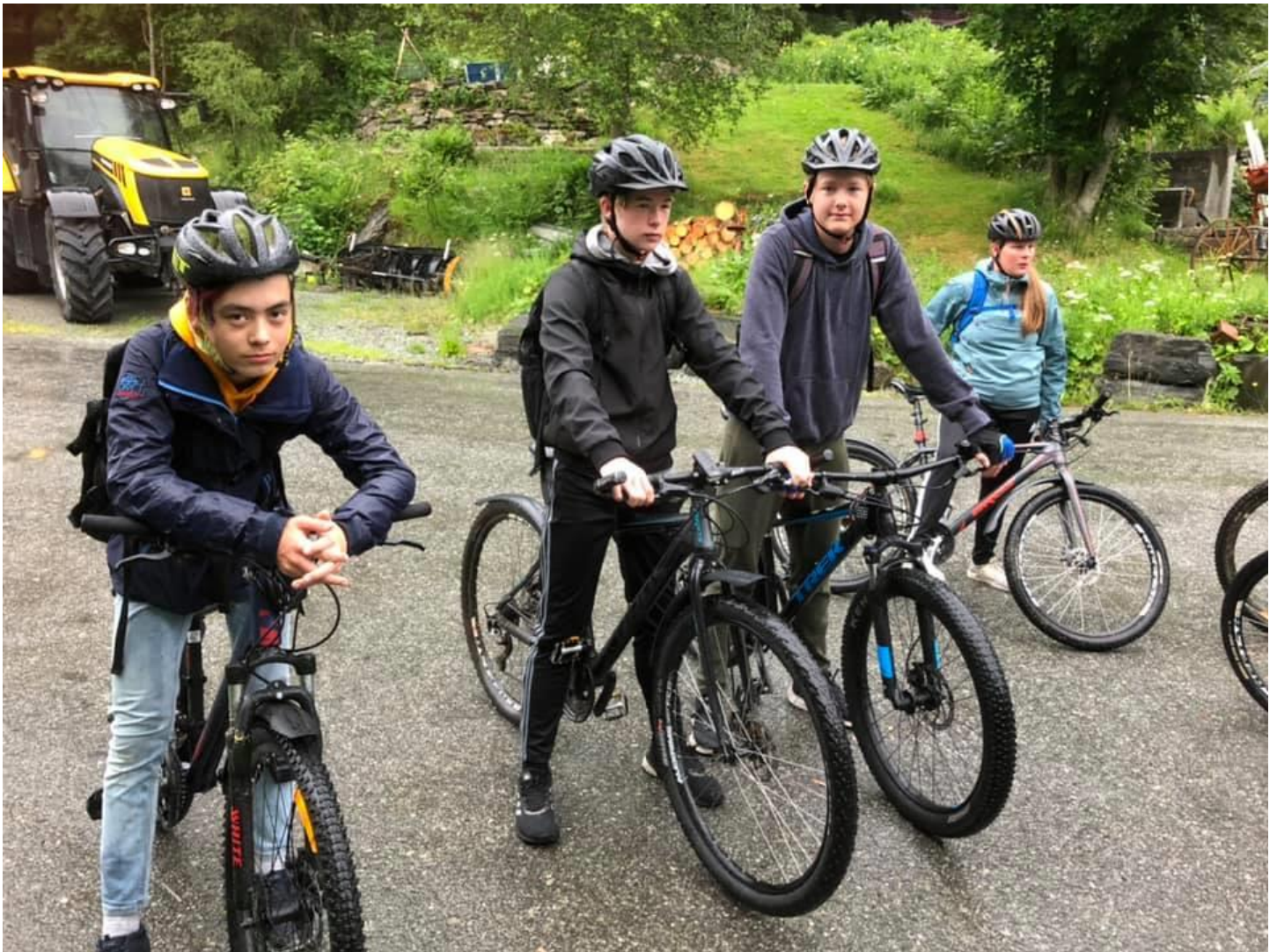
Konfirmanter klar for sykkelstur