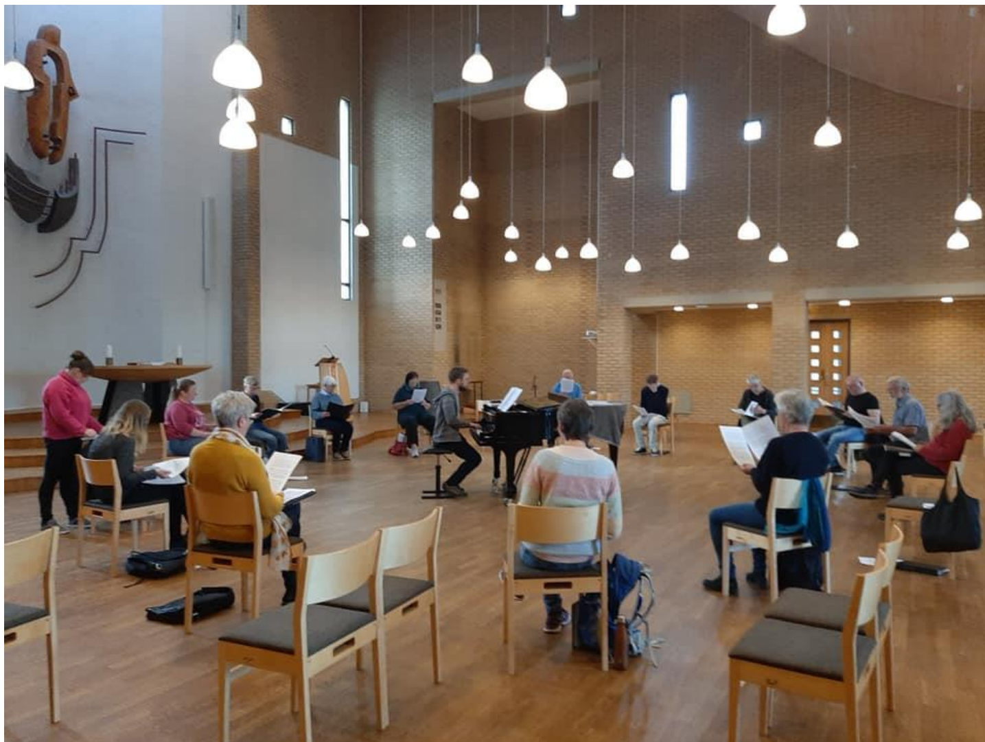
Korøvelse med Udlandkoret kom i gang igjen før sommeren 2020, da med stor avstand.