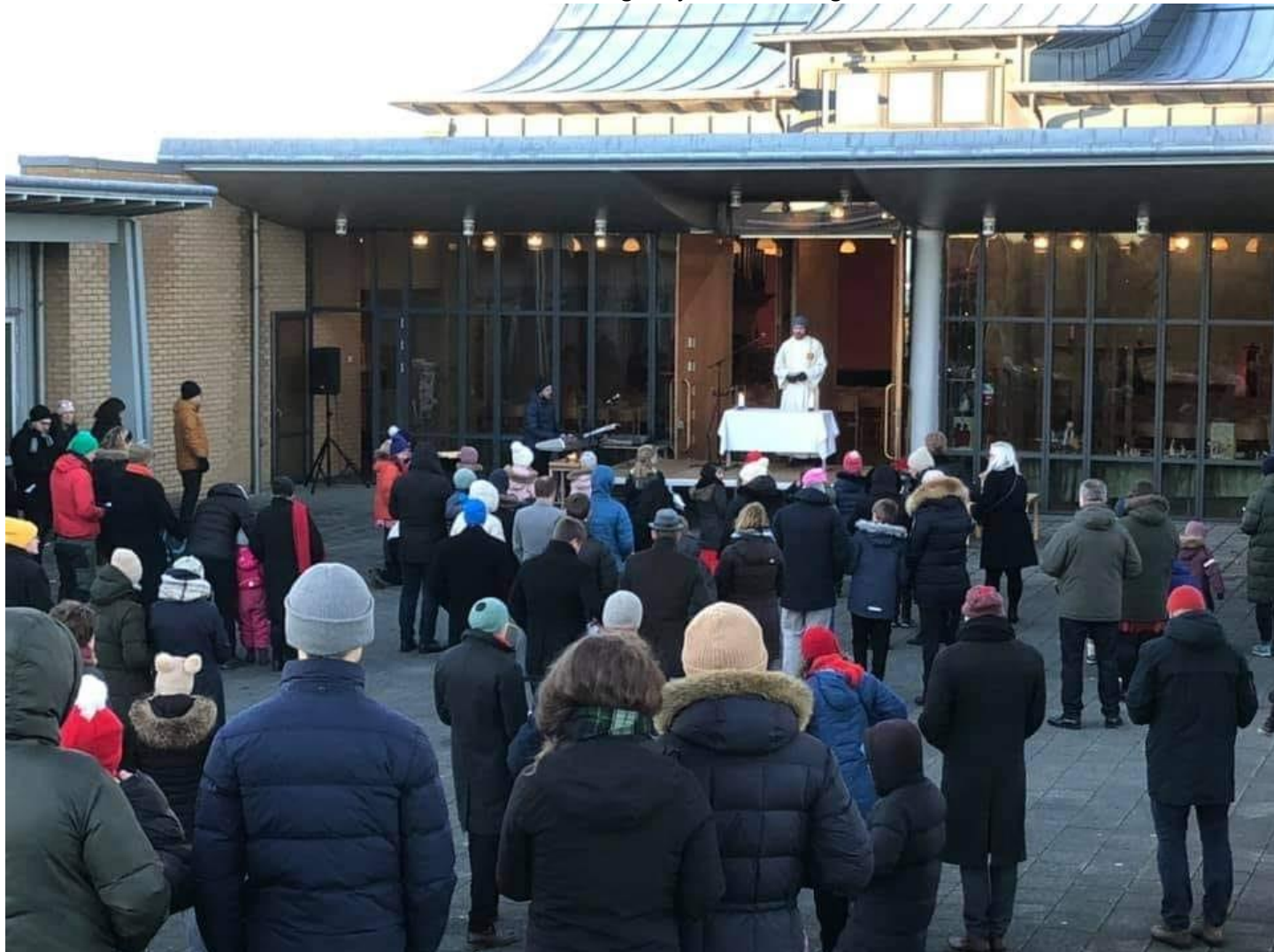
Historisk på kirkebakken julaften med utegudstjenste

tilnærmet normal måte. Vi var inne i en tilnærmet normal gudstjenestehverdag i høst fram til slutten av oktober da en