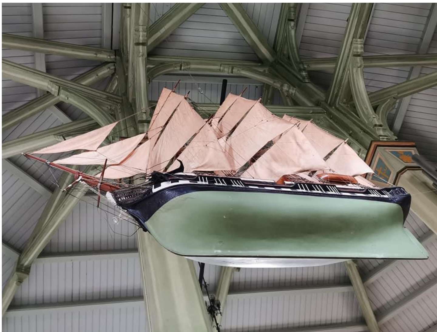
Skipet henger tryg og har stø kurs i Skåre kirke

I 2020 var det ikke stor aktivitet i styre og komitearbeid men likevel noe aktivitet i kirken på tross av pandemien.