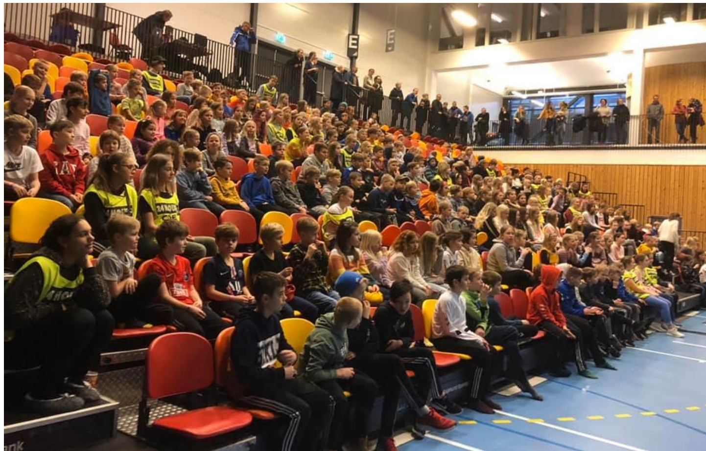
24 Hour-festival samler mange barn og er en stor suksess