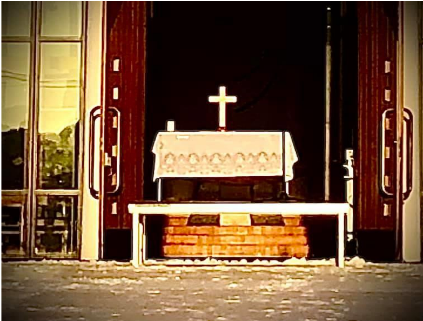
Alterbordet flyttet ut til folket i 2020

Årsmeldingen fra Skåre menighet beskriver på forskjellige måter det meste av det som skjer i menigheten. Dette er Skåre menighetsråd sin måte å oppfylle Kirkeordning for Den norske kirke §12 hvor det står: «Menighetsrådet gir hvert år menighetsmøtet en orientering om det kristelige arbeidet i soknet.» La oss begynne med Den norske kirke – en evangelisk-luthersk folkekirkes kirkes visjon: