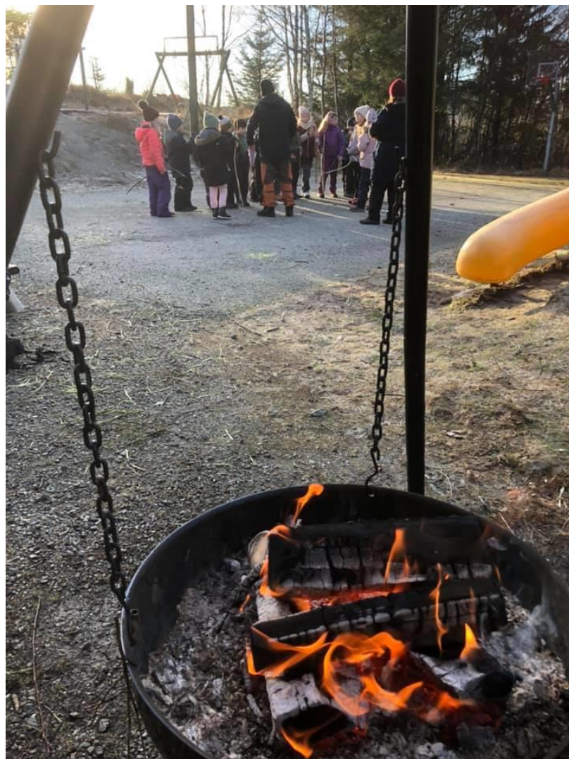
Bålet er tent for uteaktivitet

Vi kan naturligvis ikke forvente at avkastningen er på et så høyt nivå hvert år. Normalt må man forvente at 3 av 10 år med forvaltning faktisk gir negativ avkastning. Over tid vil normalt de 7 gode årene sørge for at avkastningen over tid blir god.